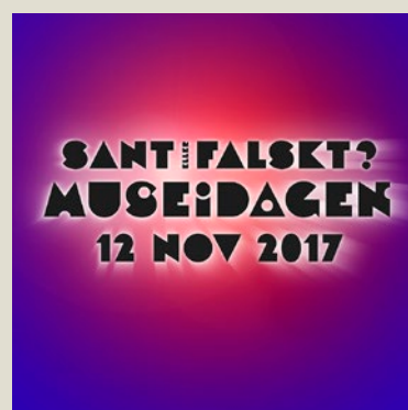
MUSEIDAGEN SANT ELLER FALSKT? 12 NOV KL 12 – 16