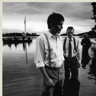
FÖREDRAG OM HANS GEDDA 16 NOV KL 19.00