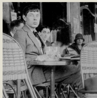
FÖREDRAG BROR HJORTH I PARIS TORS 12 OKT KL 19