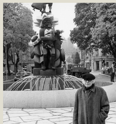
KONSTVANDRING BROR HJORTH PÅ STAN LÖR 14 OKT KL 10.30